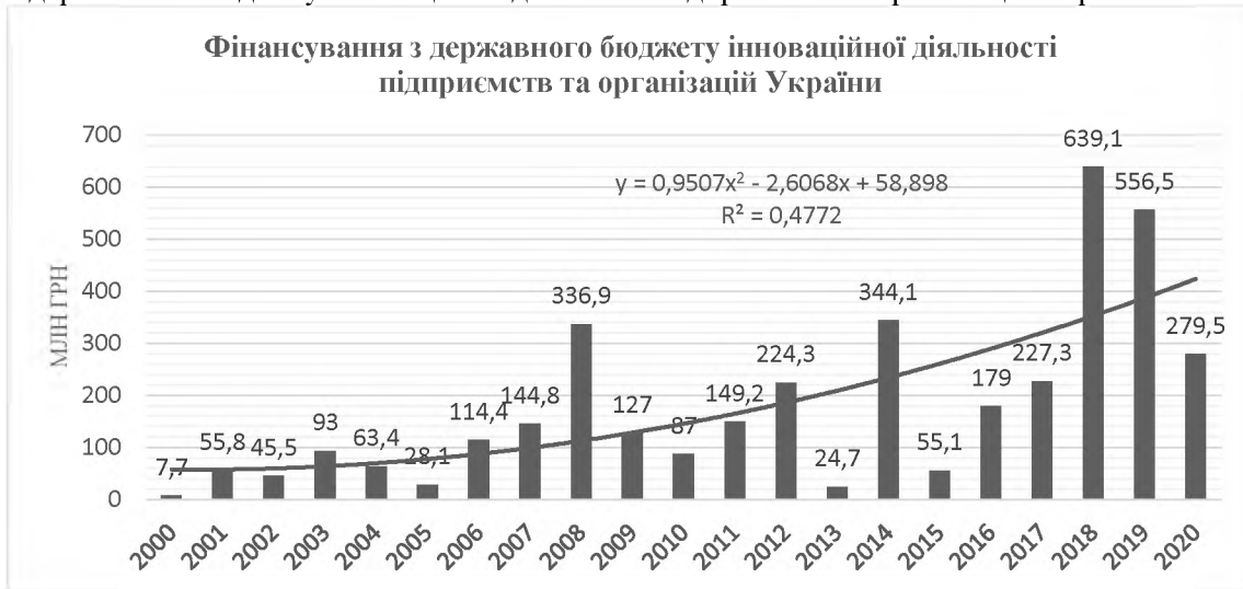
Рис. 2. Фінансова підтримка діяльності підприємств та організацій з державного бюджету Джерело: Державна служба статистики України [1]

Розвиток інноваційного бізнесу базується на застосуванні сучасних інновацій та економіки знань. Важливим напрямом є державна підтримка бізнесу. На рис. 2 представлено фінансування з державного бюджету інноваційної діяльності підприємств та організацій України.