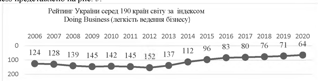
Рис. 5. Рейтинг України серед 190 країн світу за Doing Business Index

В сучасному світі запроваджено різні методики оцінювання активності та сприятливості ведення бізнес-процесів. Всесвітній банк здійснює оцінку ведення бізнесу серед 190 країн світу. Індекс легкості ведення бізнесу (Doing Business Index) складається з 10 субіндексів. Останній звіт «Doing Business 2020», представлений Світовим банком, висвітлює результати досліджень щодо свободи ведення бізнесу [13]. Рейтинг України серед інших країн світу за індексом Doing Business представлено на рис. 5.