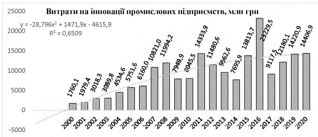
Рис. 4. Динаміка витрат промислових підприємств на інновації за період 2000-2020рр. Джерело: Державна служба статистики України [1]

В сучасному світі запроваджено різні методики оцінювання активності та сприятливості ведення бізнес-процесів. Всесвітній банк здійснює оцінку ведення бізнесу серед 190 країн світу. Індекс легкості ведення бізнесу (Doing Business Index) складається з 10 субіндексів. Останній звіт «Doing Business 2020», представлений Світовим банком, висвітлює результати досліджень щодо свободи ведення бізнесу [13]. Рейтинг України серед інших країн світу за індексом Doing Business представлено на рис. 5.