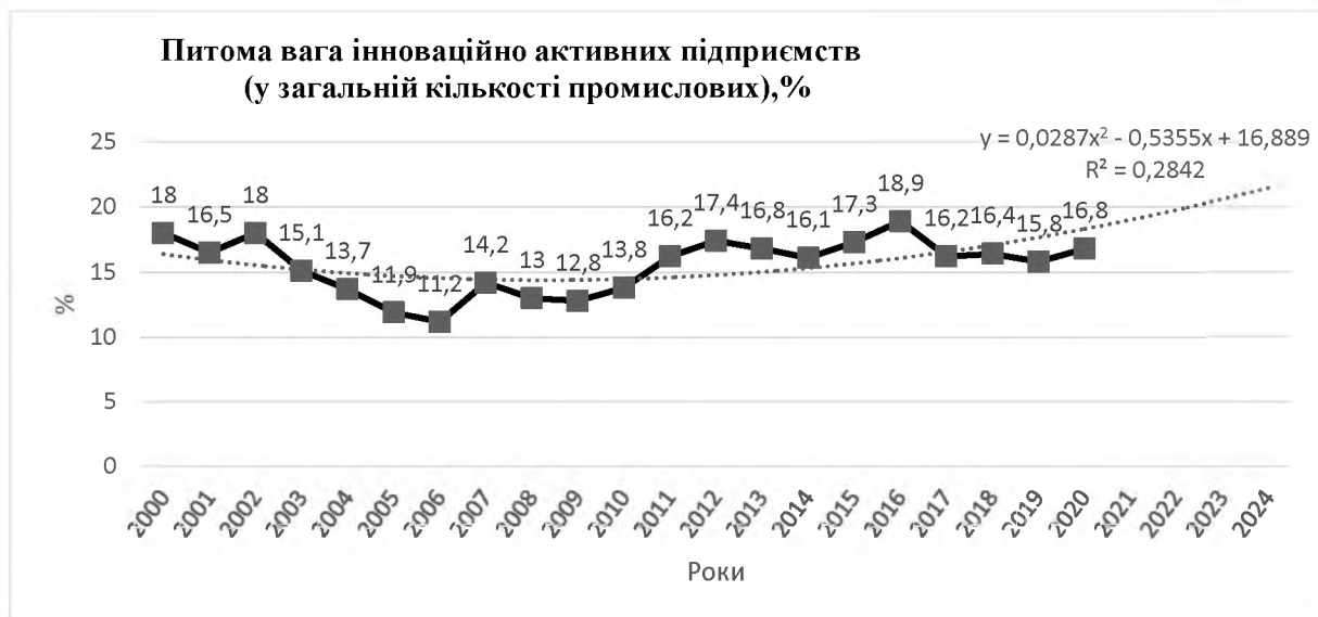
Рис. 3. Інноваційна активність вітчизняних підприємств (питома вага в загальній кількості промислових підприємств)

Проаналізуємо інноваційну активність вітчизняних підприємств (рис. 3).