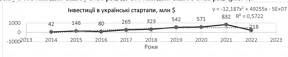
Рис. 6. Динаміка інвестування в українські стартапи за період 2014-2022 рр. Джерело: фонд AVentures Capital [12]

Погіршення ділового середовища призвело до зменшення обсягів інвестування в українські стартапи. Хоча це було очікуване падіння, але з початком війни у 2022 році значна кількість інвесторів заморозили угоди. Відбулося різке зменшення обсягів інвестування з рекордного обсягу в 832 млн дол. США у 2021 році до 218 млн дол. США в 2022 році (рис. 6).