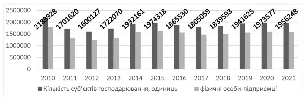
Рис. 1. Порівняльна характеристика загальної кількості суб'єктів підприємницької діяльності і зареєстрованих фізичних осіб-підприємців за період 2010-2021рр.

Як свідчать дані табл. 1, за період 2010 – 2021 рр. в Україні відбулося зменшення кількості суб'єктів господарювання на 227680 од., що становить 10,4%. Протягом аналізованого періоду спостерігаються тенденції до спаду активності бізнес-структур (в 2012р., 2017р. та 2021р.), на що вплинули всесвітня фінансово-економічна криза, політичні події в країні, пандемія тощо. Активізація підприємницької діяльності спостерігається в 2015р. та 2020р., де відбулось збільшення кількості підприємницьких структур, що є позитивною тенденцією (рис. 1).