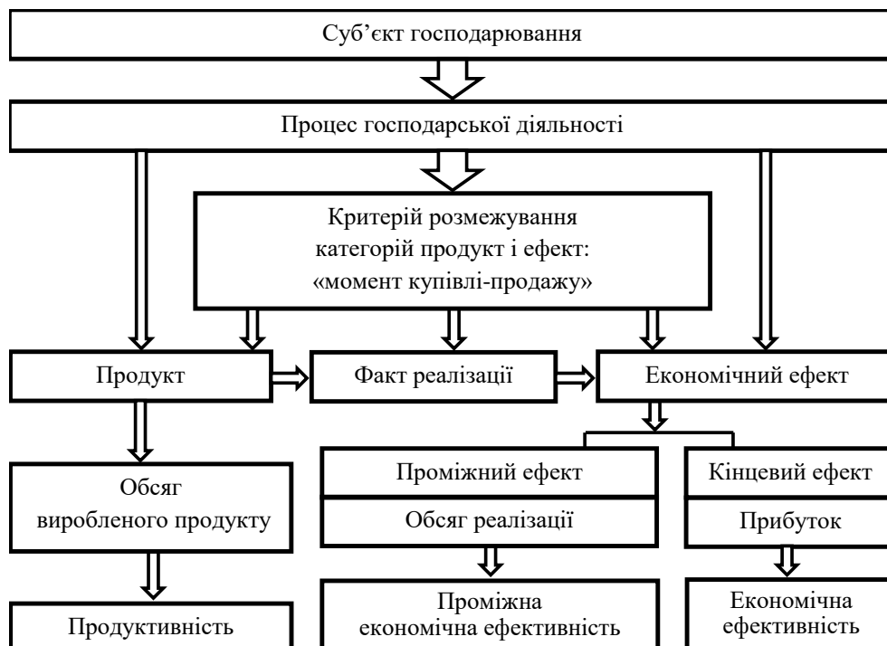
Рис. 2. Критерій розмежування категорій «продукт» і «економічний ефект» і особливості формування категорій «продуктивність», «проміжна ефективність», «економічна ефективність» («кінцева економічна ефективність»)

Дохідність та прибутковість – це завжди відносні величини і розраховуються вони як відношення відповідно доходу та прибутку до величин, що пов'язані з ними (визвали їх), тобто з певними видами витрат.