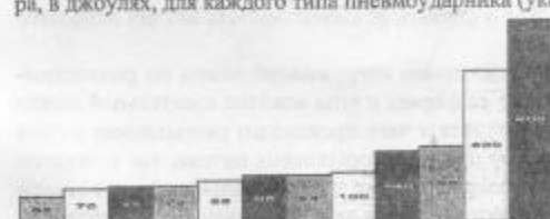
Рис. 1. Энергия единичного удара пневмоударников

Энергетические возможности существующих отечественных погружных пневмоударников взяты из их технических характеристик. На рис. 1 представлены значения энергии единичного удара, в джоулях, для каждого типа пневмоударника (указаны внутри прямоугольников диаграммы).