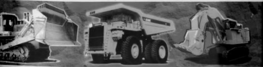
Кривой Рог 2010