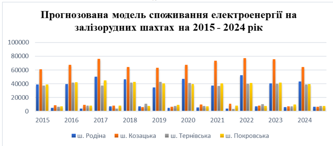
Рис. 2. Прогнозована модель споживання електроенергії для схем електропостачання складених згідно концепції Smart Grid для залізрудних шахт на 2015–2024 рік

На основі скоригованої, прогнозованої моделі споживання електроенергії для схем електропостачання складених, згідно концепції Smart Grid у залізрудних шахт (табл. 4–7, Формули 4 та 5) будуюмо дану графічну залежність від коефіцієнту m_n :