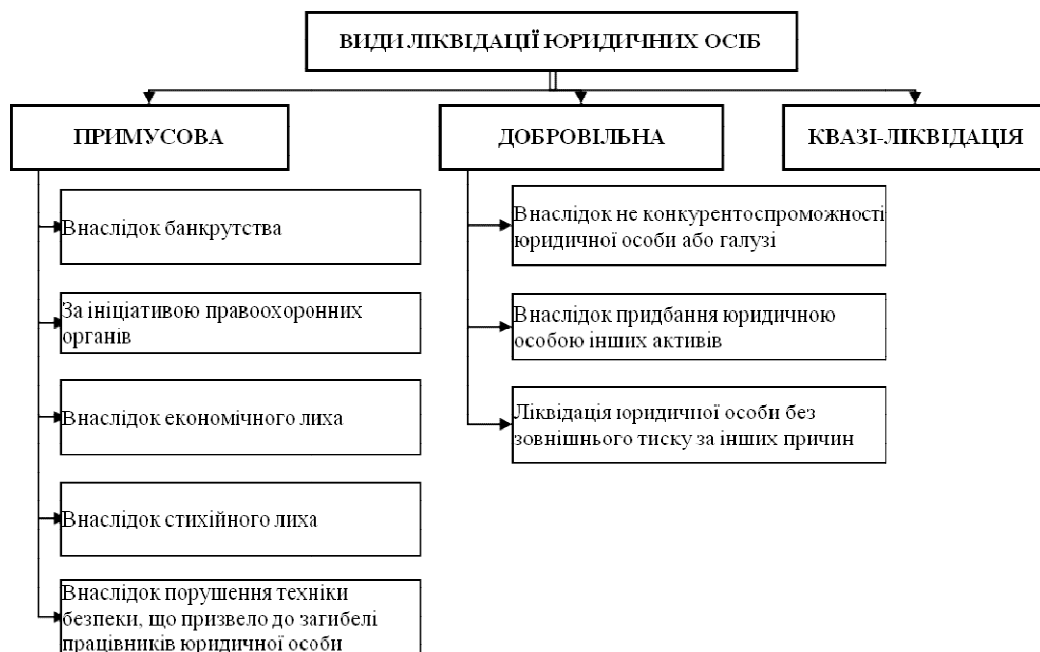
Рис. 3. Класифікація видів ліквідації юридичних осіб (розроблено автором)

Ураховуючи наведене вище пропонуємо уточнити класифікацію видів ліквідації юридичних осіб та її можливих причин (рис. 3).