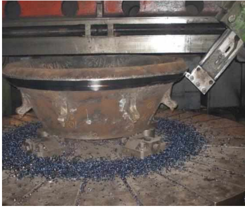
Рис.1. Оброблення броні конусної дробарки на токарно-карусельних верстатах