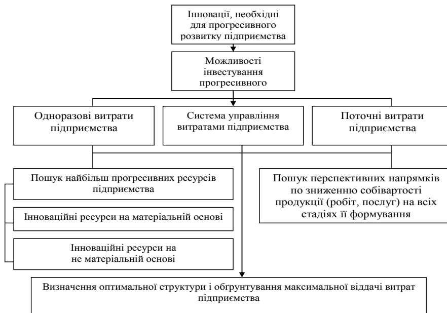
Рис. 3 Взаємозв'язок інвестицій, інновацій і системи управління витратами підприємства

На рис. 3 представлено взаємозв'язок інвестицій, інновацій і систему управління витратами на підприємстві.