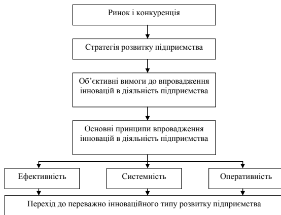
Рис. 2 Основні принципи переходу до формування інноваційного типу розвитку підприємства.

Саме ці базові принципи у єдності з іншими принципами утворюють можливість до переходу підприємства на переважно інноваційний тип розвитку (рис. 2).