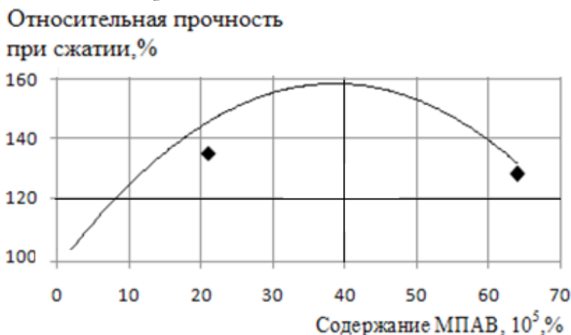
Рис. 2. Влияние содержания МПАВ на прочность бетона при сжатии в возрасте 7 суток

рошок» мицеллообразующего ПАВ (МПАВ) приводит к резкому увеличению прочности получаемого бетона в возрасте 7 суток (рис. 2). При этом отмечается наличие оптимального содержания МПАВ в количестве 0,0002–0,0004% от массы цемента, которое обеспечивает формирование максимальной прочности системы.