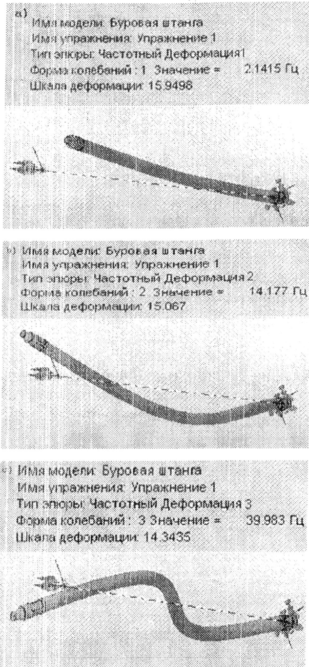
Рисунок 3. Формы и частоты собственных колебаний буровой штанги размером 180×50×8000 мм

Если сравнить таблицы 2 и 3, можно увидеть, что третий ряд третьей шарошки создаст частоту возбуждения 40 Гц. Это очень близко к третьим модам 39,98 Гц, 39,87 Гц и 39,63 Гц собственных колебаний бурового става, состоящего из одной штанги при усилиях подачи 60, 120 и 240 кН.