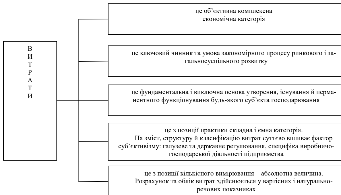
Рис.1. Парадигма і основні постулати дослідження категорії «витрати»

галузевого й державного регулювання, по-четверте, вимірюється кількісно – як абсолютна величина, по-п'яте, відображається в розрахунках та обліку у вартісних, а при необхідності і у натурально-речових показниках.