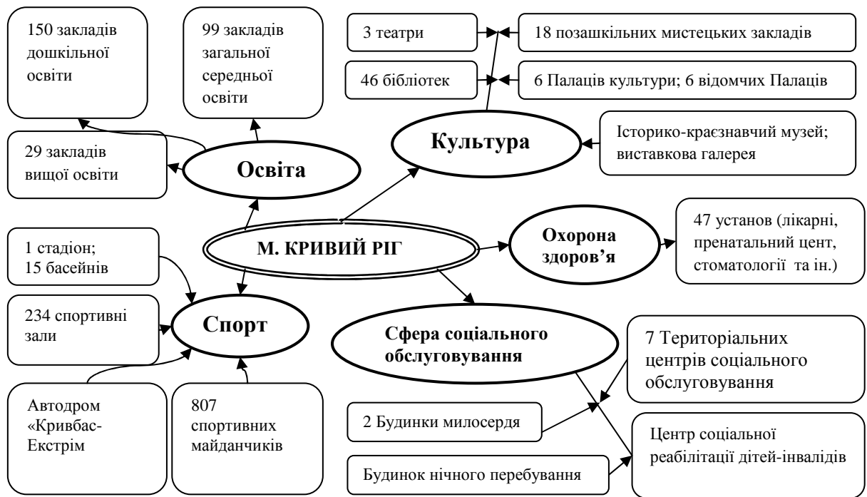
Рис. 2. Структура соціальних об'єктів м. Кривого Рогу [7]

Найбільші підприємства міста - це ПрАТ «АрселорМіттал Кривий Ріг» та підприємства, які входять до ГРУПИ МЕТІНВЕСТ.