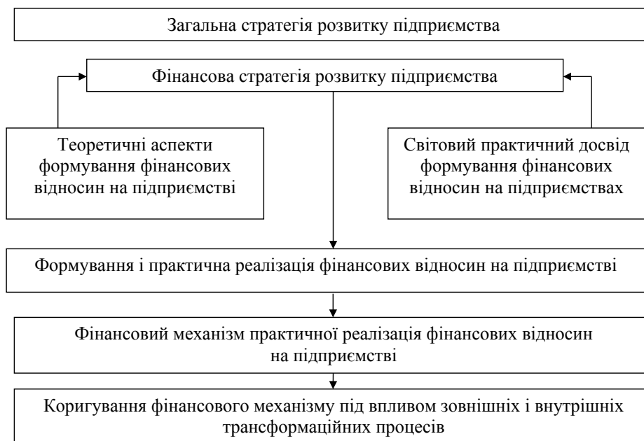
Рис. 3. Фінансова стратегія і практична реалізація фінансових відносин на підприємстві

На наш погляд, важливо показати місце фінансової стратегії у наборі основних видів конкурентного розвитку підприємства (рис. 4).