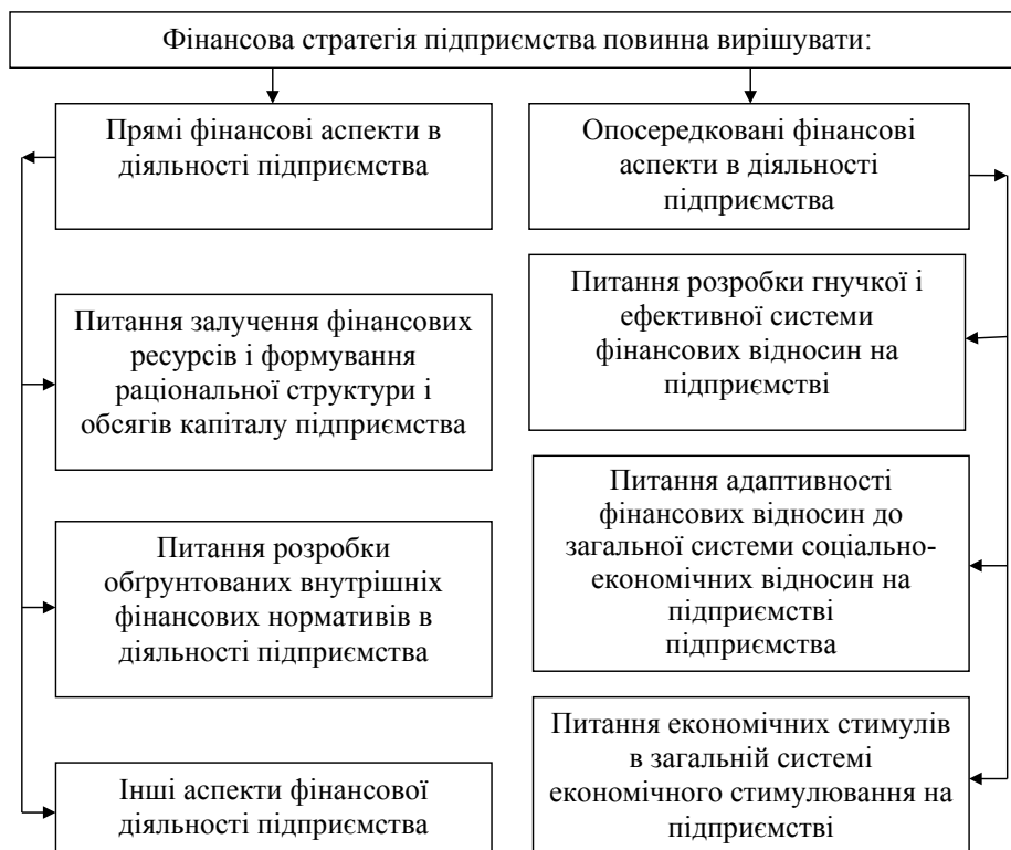
Рис. 2. Фінансова стратегія підприємства і основні аспекти, які вона повинна враховувати