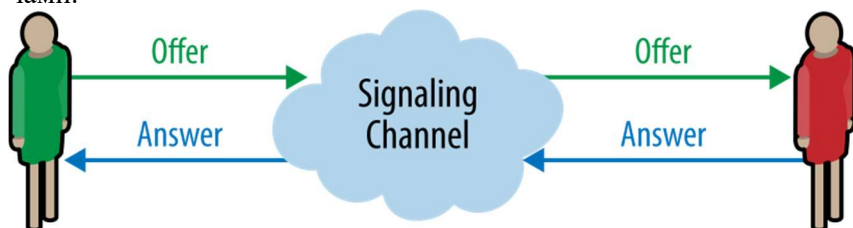
Рис. 1. Сигналізація і узгодження сеансу

Для створення додатку необхідна незначна кількість програмного коду JavaScript, і будь-який веб-додаток може забезпечити багатий досвід проведення телеконференцій за допомогою передачі даних. На рис. 1 наведено схему узгодження сеансу між користувачами.