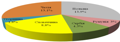
Рис. 1. Структура експортних поставок залізорудної сировини з України на Східноєвропейський зарубіжний ринок за країнами, %

Вміст заліза у залізорудних концентратах, що поставлялись українськими підприємствами до країн Східної Європи, становив: на ПАТ «Північний ГЗК» 65,5 %, ПАТ «Центральний ГЗК» 65,6 %, ВАТ «Південний ГЗК» 65,0 %, ПАТ «Інгулецький ГЗК» 64,0 %, ПАТ «АрселорМіттал Кривий Ріг» 65,6 %. Для порівняння: якість концентрату основних зарубіжних конкурентів на цьому ринку становила: Ferteco (Бразилія) 67,8 %; шведських компаній LKAB, KBF (Kiruna) 69,8 %, LKAB, MAF (Malmberget) 70,7 %; російських підприємств Лебединський ГЗК 68,3 %, Стойленський ГЗК 66,5 % [4]. Зважаючи на потребу в набутті конкурентних переваг українськими виробниками на Східноєвропейському сегменті міжнародного ринку, слід інвестувати в інноваційні технології підготовки залізорудної сировини для споживачів.