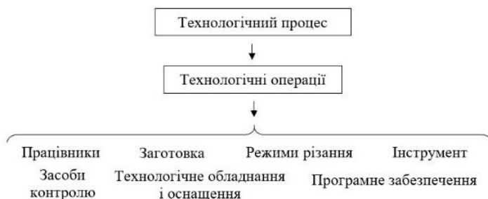
Рис. 1. Складові технічної системи

Технічна система – це сукупність елементів та взаємозв'язків між ними, які створюють цілісну структуру об'єкту. У якості технічної системи в даній роботі розглядається технологічний процес виготовлення партії деталей, як основна частина виробничого процесу. Основні складові елементи технічної системи зображено на рис. 1.