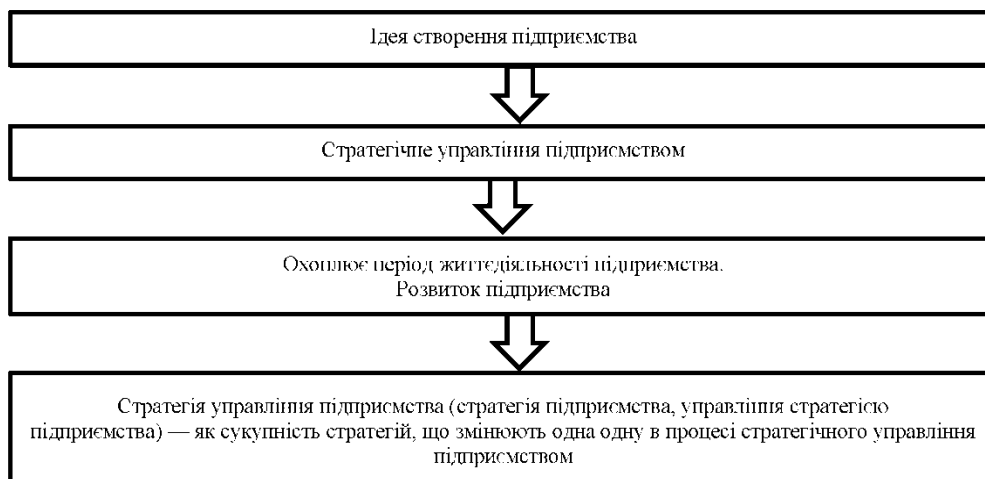
Рис. 2. Підпорядкованість понять в системі стратегічного управління підприємством

Одна стратегія управління підприємством (стратегія підприємства) в процесі життєдіяльності підприємства, через вплив різних чинників і обставин, змінюється за потреби іншою стратегією або певним чином удосконалюється (рис. 2)