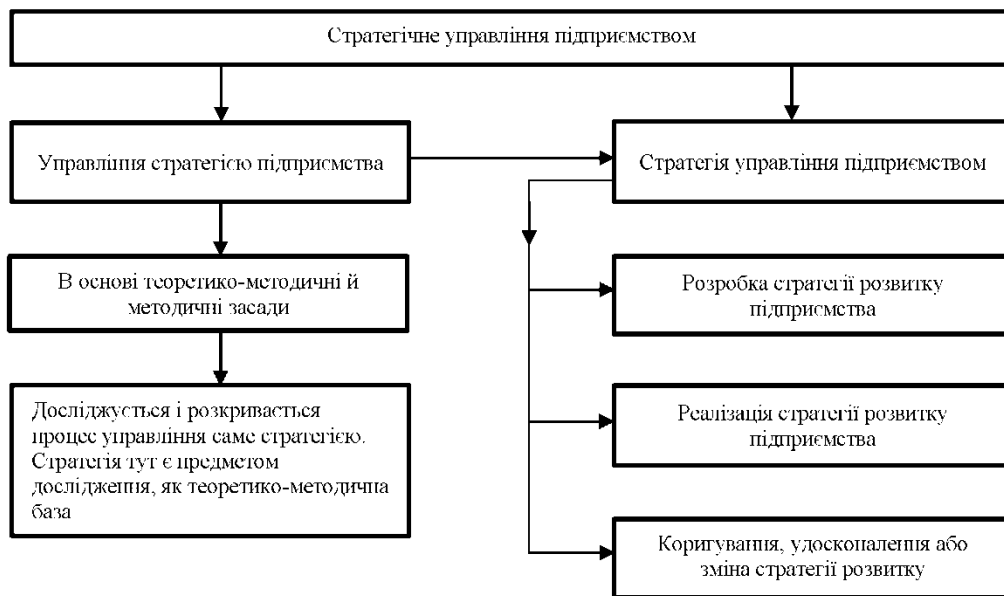
Рис. 3. Структура і змістовність стратегічного управління на підприємстві

Таке розуміння сутності поняття «стратегічне управління підприємством» є основою до побудови структури й системи співвідношення різних понять в системі стратегічного управління підприємством (рис. 3).